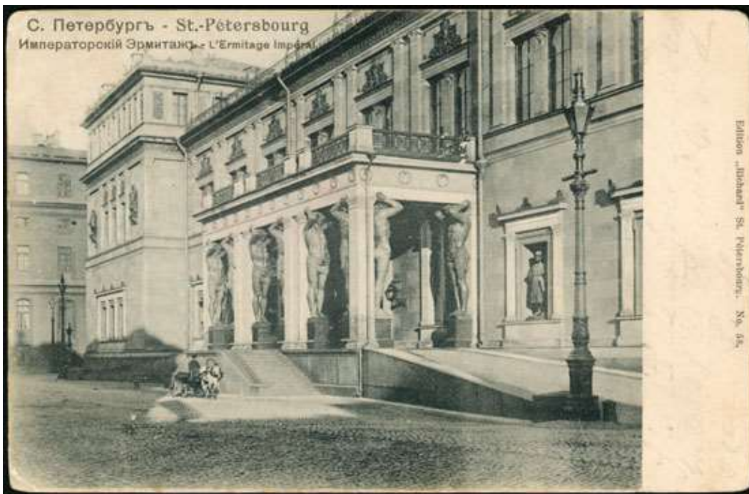
1880 — Совершено пятое покушение на императора Александра II. Взрыв в Зимнем дворце в Санкт-Петербурге, подготовленный Степаном Халтуриним.