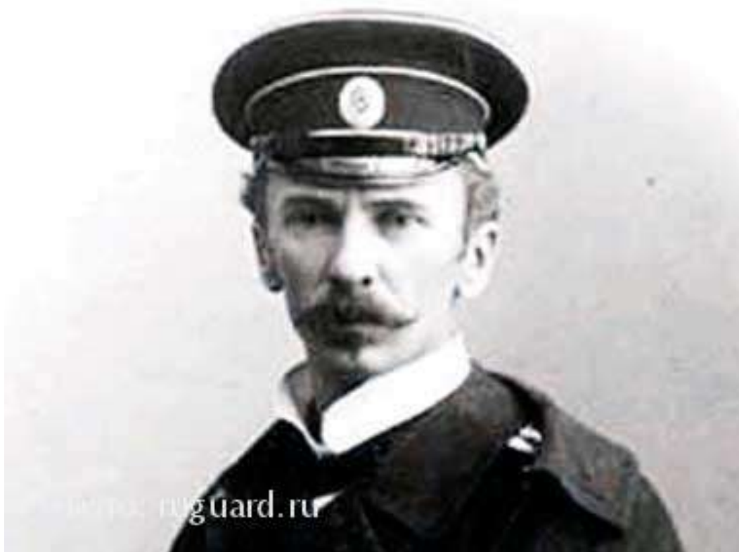
1870 — Георгий Аполлонович Гапон , политический деятель, священник.

Черноморским флотом. В ночь на 26 ноября восставшие прибыли на крейсер «Очаков» и призвали моряков присоединиться к восстанию. Матросы под руководством большевиков А.Гладкова и Н.Антоненко захватили крейсер в свои руки. Офицеры, пытавшиеся разоружить корабль, были изгнаны на берег. Вскоре к восставшим присоединились 12 кораблей с численностью экипажей более 2200 человек. На мятежных кораблях были подняты красные флаги. 27 ноября Шмидт отправил телеграмму Николаю II: «Славный Черноморский флот, свято храня верность своему народу, требует от вас, государь, немедленного созыва Учредительного собрания и не повинуется более вашим министрам. Командующий флотом П.Шмидт». Однако власти предприняли ответные меры, и вскоре мятеж был подавлен. Шмидт был приговорён военно-морским трибуналом к смертной казни.