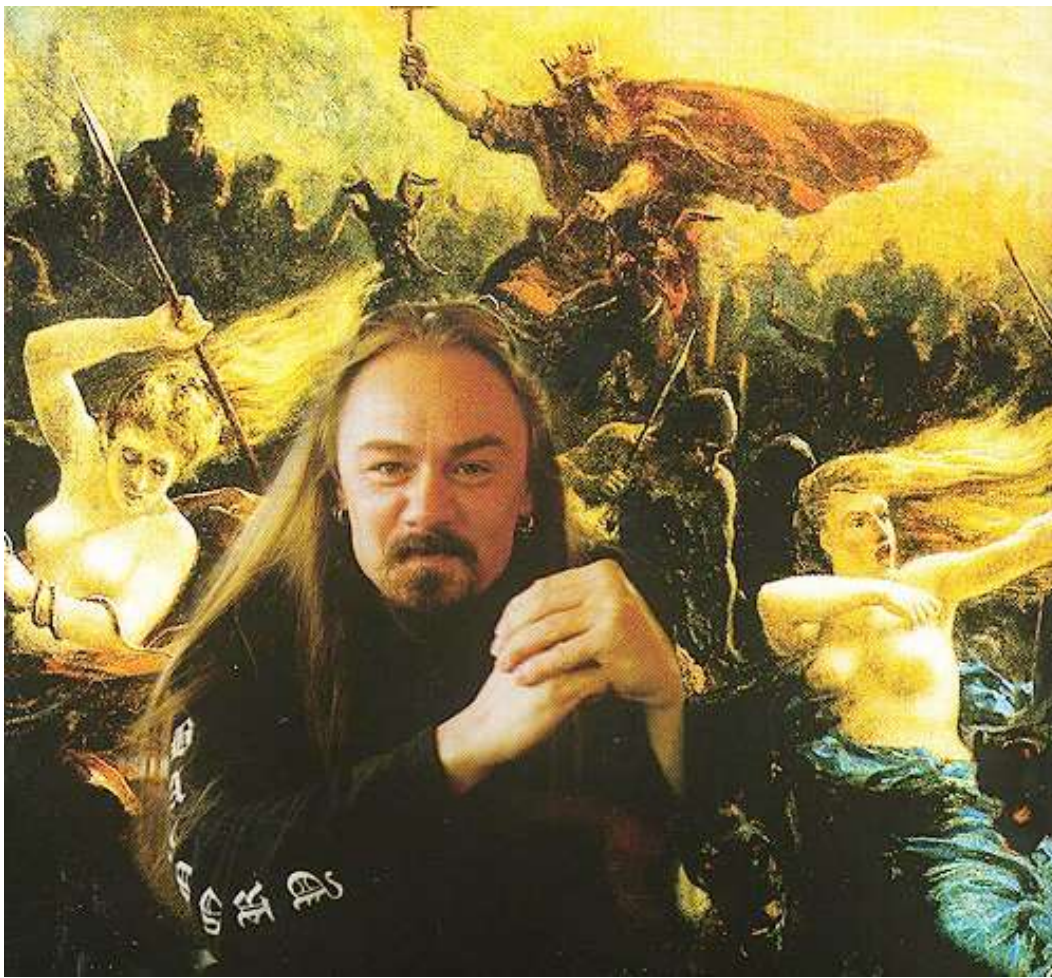
1981 — Пэрис Хилтон, американская актриса и фотомодель.