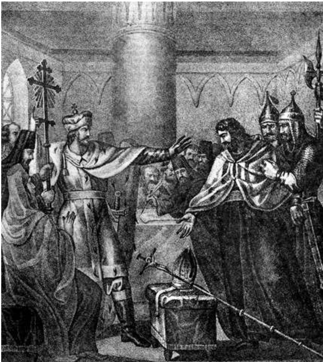
1598 — По решению Земского собора взошёл на трон царь и великий князь Московский Борис Годунов.