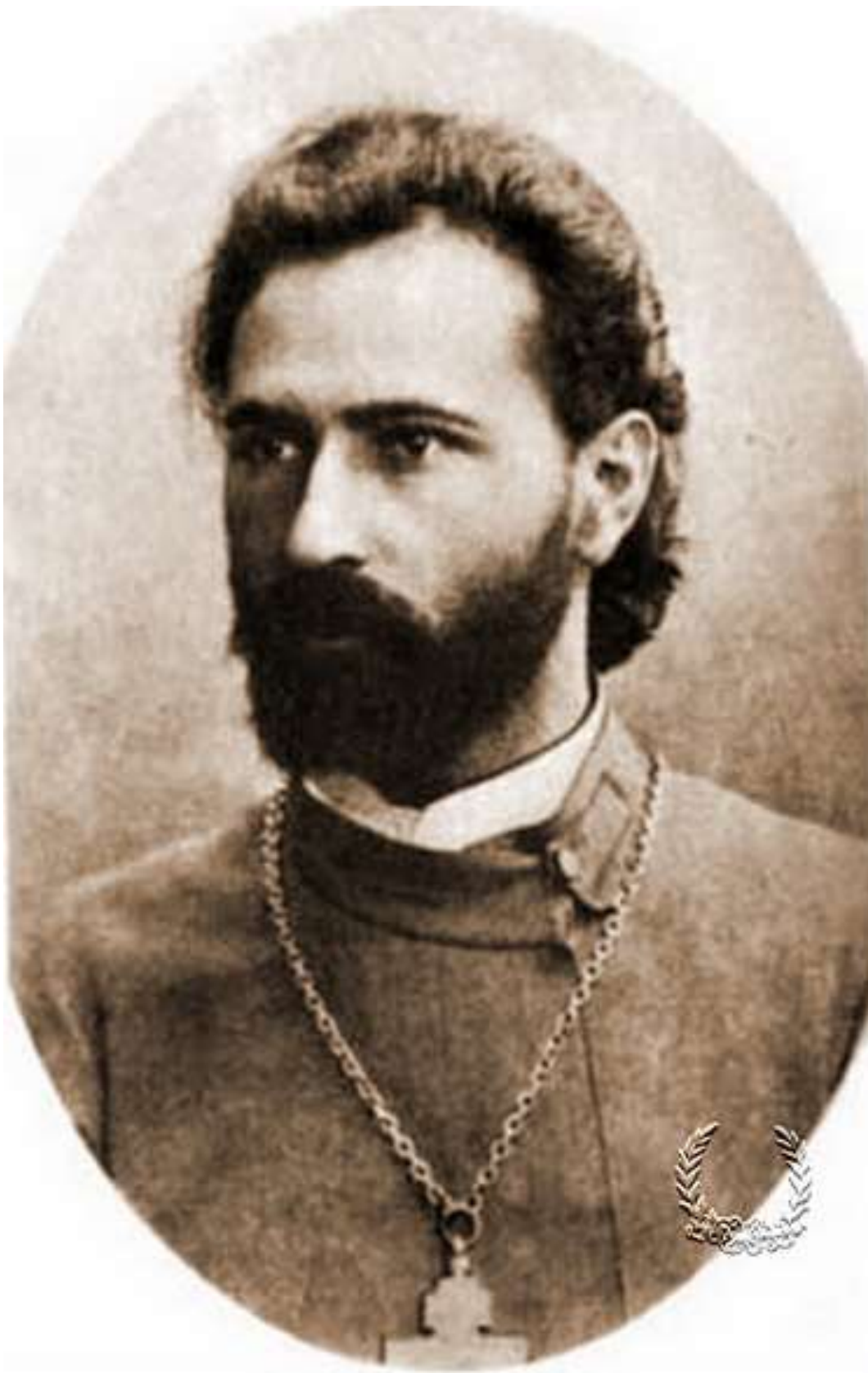
1906 — Агния Львовна Барто , русская советская писательница, автор стихотворных произведений для детей.